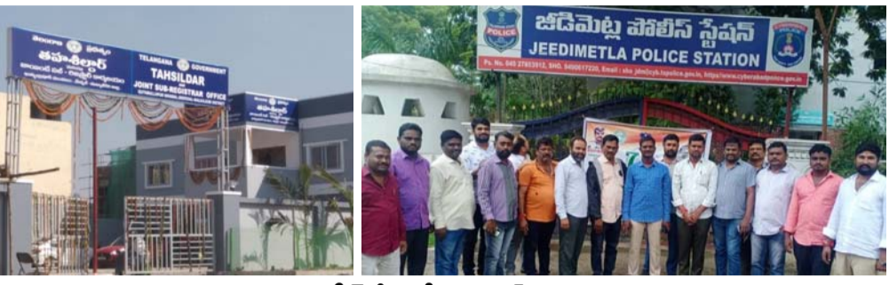
పోలీస్ స్టేషన్లో కంప్లెంట్ ఇచ్చింది